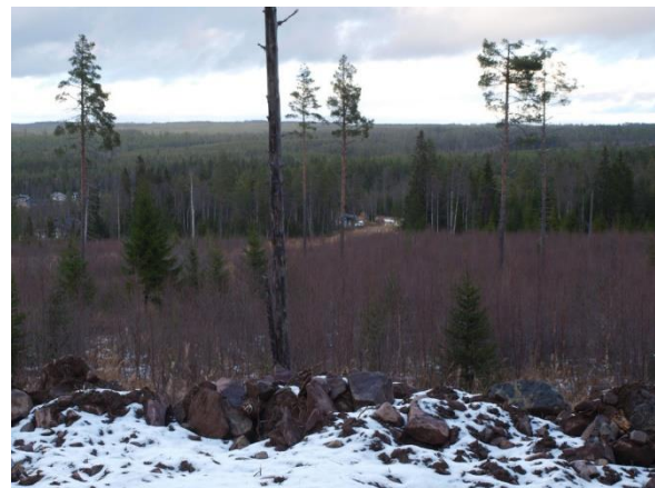
Vy över delobjekt 1